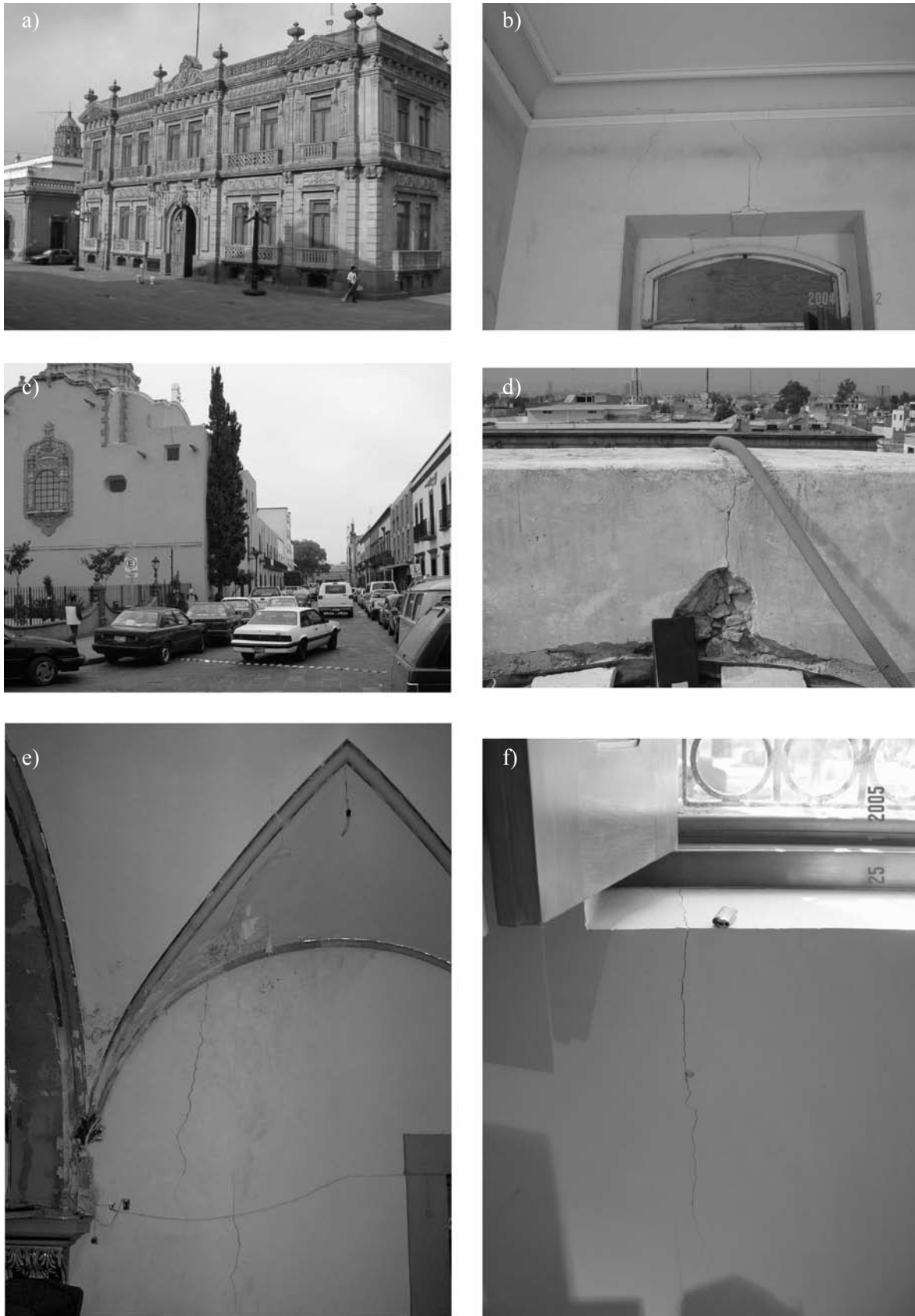
Figura 2. Edificios históricos del centro de San Luis Potosí y sus afectaciones. a) y b) Fachada y agrietamiento del Museo de la Máscara; c) y d) Frente principal del Museo Regional y agrietamiento en la azotea del mismo; e) Agrietamiento extremo en la nave de la Iglesia del Espíritu Santo y f) Fracturamiento incipiente en el Museo Federico Silva (Localización ver Figura 1).